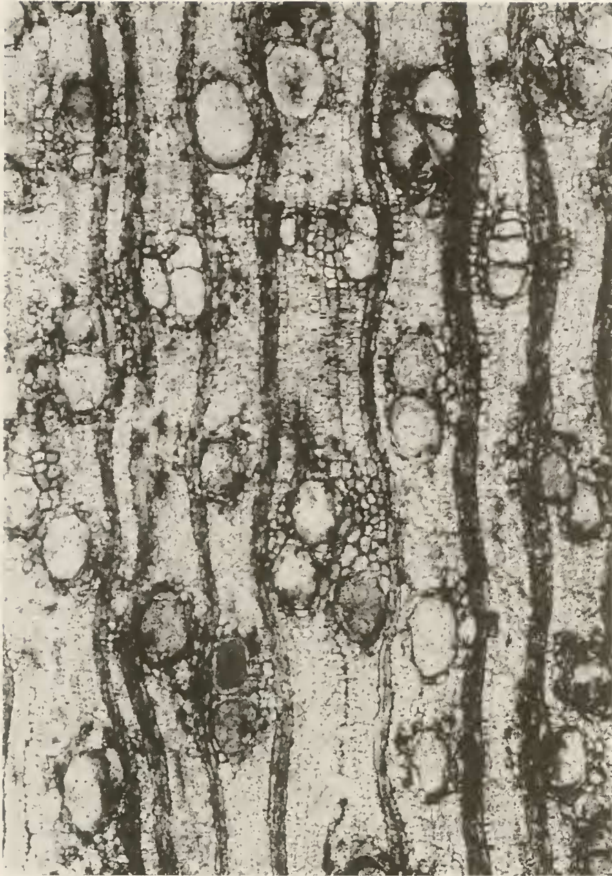
Abb. 3. Cinnamomoxylon cf. limagnense – Querschliff. Verstreute Poren, Holzstrahlen und vasizentrisch-confluentes Parenchym; \times 65 .

\mu\text{m} ) hoch, ein teils 4-reihiger Holztrahl 16 Zellen ( 252 \mu\text{m} ) hoch; in Astnähe verquirlte Struktur der Holzstrahlen, Astzellen polygonal, Durchmesser 12\text{--}31\text{--}(70) \mu\text{m} ; Holzstrahlzellen heterozellular, liegend, quadratisch oder vertikal gestreckt, liegende Zellen vertikal 19\text{--}25 \mu\text{m} , Kantenzellen vertikal bis 56 \mu\text{m} , Ölioblasten als Kantenzellen bis 91 \mu\text{m} hoch; meist 7–9–(10) Strahlen je mm.